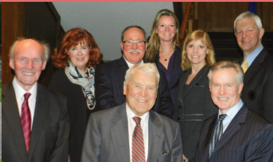
Conseil d'administration de la CDEV et SGCH